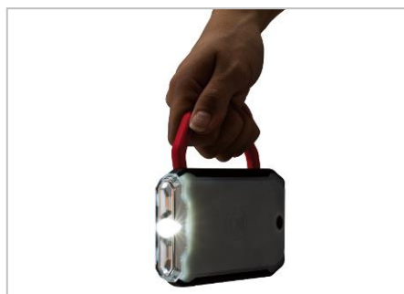
パネルは懐中電灯としても