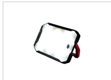
パネル背面の可動式ハンドルがスタンドに