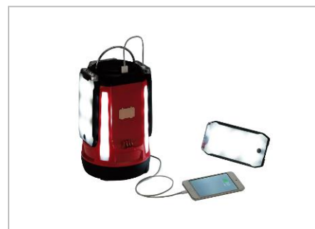
USB ポート付き本体から携帯の充電ができる