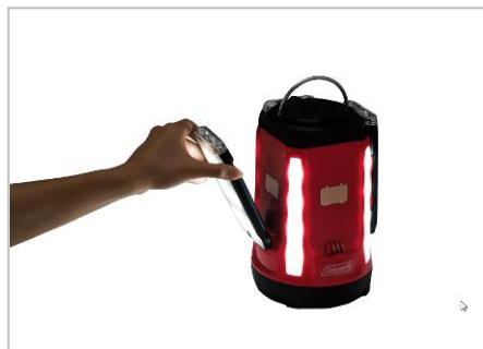
パネルを外しても本体に明かりが残る