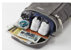
アウトドアの使いやすさ

登山バック使用のショルダーベルトとスタビライザーが、体へのフィット感を向上し負担を軽減させる。