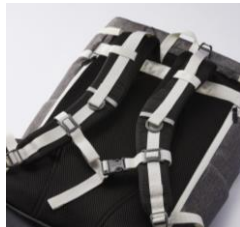
アウトドアの機能性

登山バック使用のショルダーベルトとスタビライザーが、体へのフィット感を向上し負担を軽減させる。