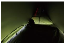
クイックアップドームの室内