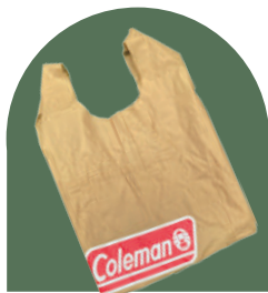
会場で実施！ 廃棄テント生地からエコバックを作ります。