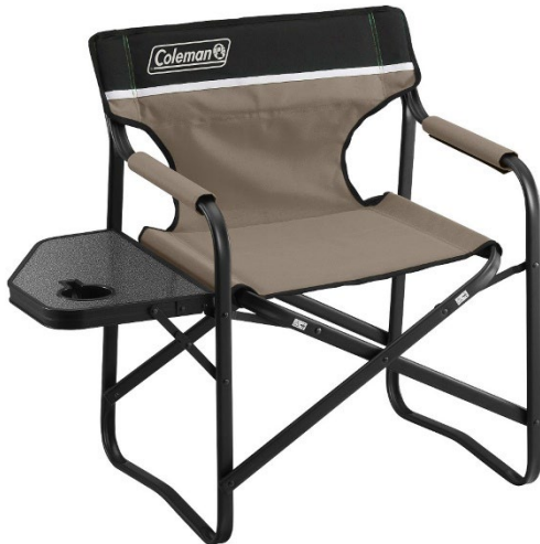
抜群の安定性と使いやすいサイドテーブル付 「サイドテーブルデッキチェア ST (グレージュ)」