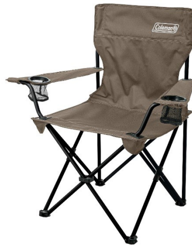
カップホルダー付きで快適な収束型チェア 「リゾートチェア (グレージュ)」