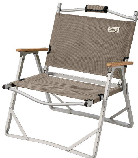
座り心地にこだわったコンパクトなロースタイルチェア 「コンパクトフォールディングチェア(グレージュ)」