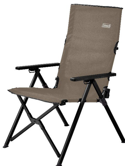
三段階のリクライニング機能でどこでもリラックス 「レイチェア(グレージュ)」