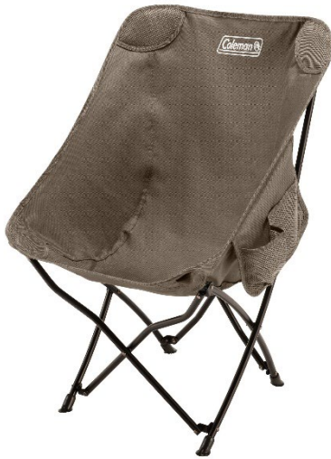
ハンモックに包み込まれるような優しい座り心地 「ヒーリングチェア NX (グレージュ)」