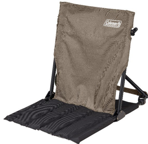
背中をしっかり支えて地べた座りも快適 「コンパクトグランドチェア (グレージュ)」