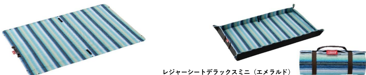
レジャーシートデラックスミニ（エメラルド）