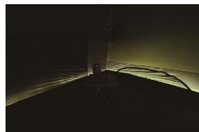
ダークルーム™テクノロジー (左: 通常テント、右: ダークルーム™テクノロジー素材テント)