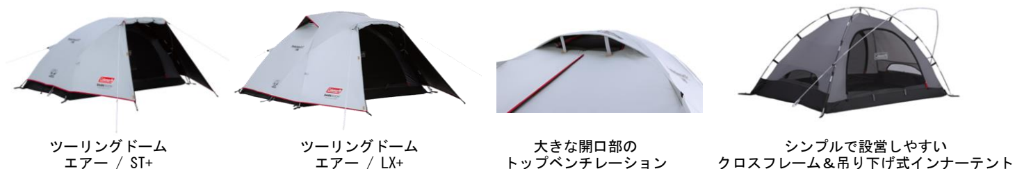
ツーリングドーム エアー / ST+

ツーリングドーム エアー / LX+ : https://www.coleman.co.jp/darkroomseries/touringdomeairlx/