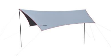
タープ単体としても使用可能