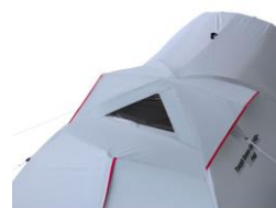
フライシート上部にクリアウィンドウを装備