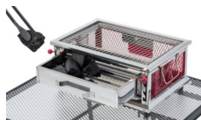
炭の継ぎ足しがしやすい 引き出し式ロストル