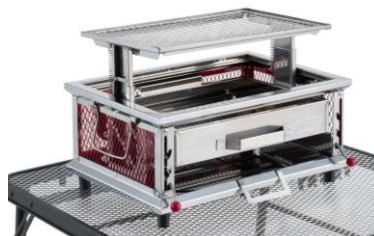
焼き網の高さで火力の調節が可能