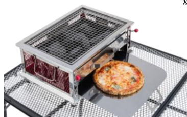
炭の熱を活用し 簡易オープンとしても使用可能