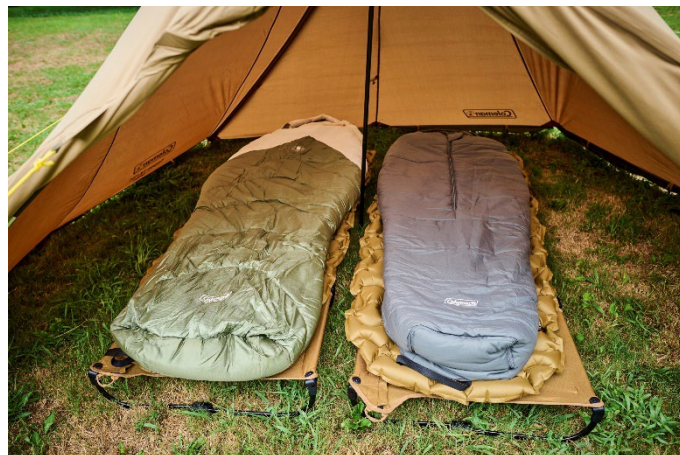
より身体に密着するシルエットで暖かさを持続 ※左：タスマンキャンピングマミー/L-8 (品番 2000038771)