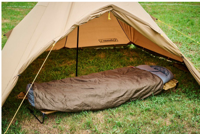
ブランケットとスリーピングバッグを 組み合わせればさらに暖かく