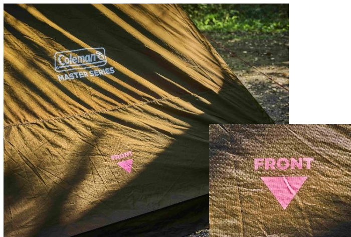
新たにフライシートの前側に「FRONT」マークを追加。スムーズな設営をサポート。