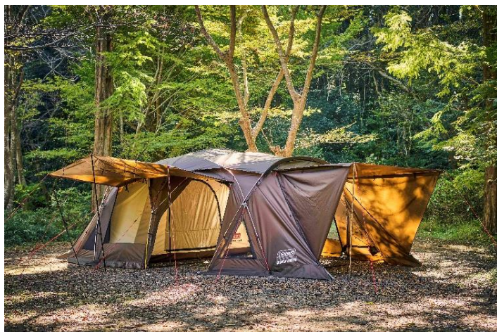
キャンプスタイルを拡げるバリエーション。