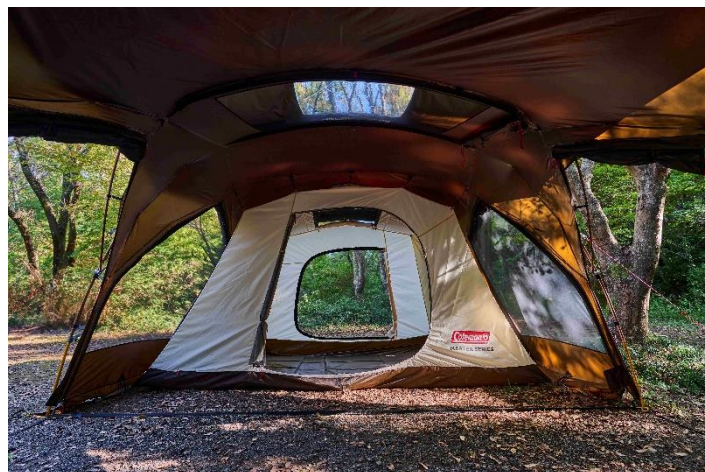
空気循環を考えつくした大型ベンチレーション。 メッシュパネルを多用し、天井には採光／換気が可能な クリアーフフライを搭載。