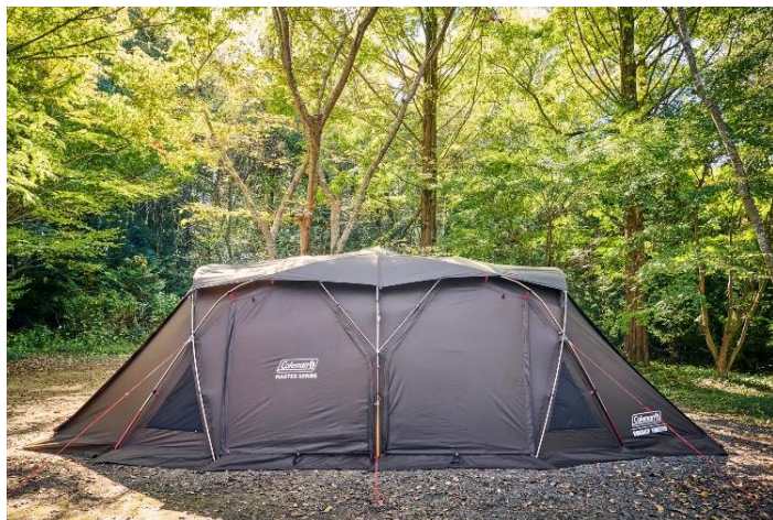
マスターブラウンで統一されたフライシート。 冬キャンプに対応するフルスカートを装備。