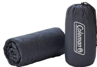
持ち運びに便利な収納ケース付