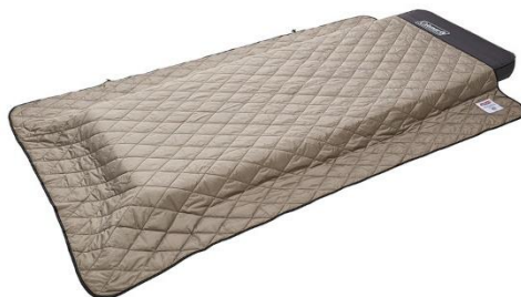
インフレーターマットなどに 敷いて快適性アップ