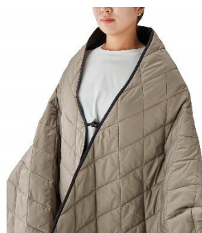
トグル付きなので 寒いときには羽織ることも可能

通常のブランケットのようにひざ掛けとしての使用はもちろん、肩にかける場合にはトグルで留めてポンチョのように羽織ることが可能です。また、インフレーターマットなどと併せて使用すれば、暖かいシートや毛布としても使用することができます。デザインは、落ち着いた色味でどのシーンでも使いやすい「グレイジュ」、鮮やかな空が楽しい気持ちを演出する「スカイ」、力強い木々が自然に馴染む「ウッド」の3種展開。持ち運びに便利な収納ケースも付属しているほか、素材にはリサイクルポリエステルを使用しています。