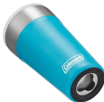
底にはボトルオープナー付