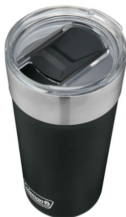
中身が見えやすい透明蓋 & スライド式飲み口