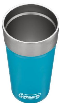
大きめの氷も入れやすい ワイドな口径