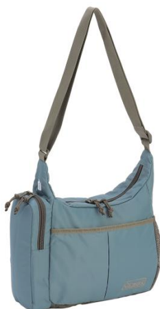
ビンテージブルー