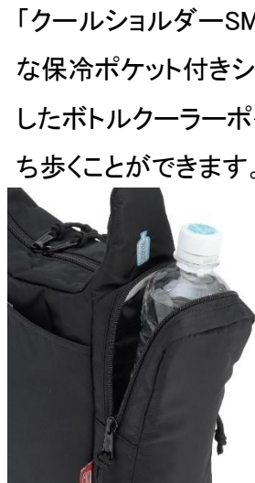
ボトルを冷やしなが 持ち歩くことができる

「クールショルダーSM」は、定番製品「クールショルダーMD」より一回りコンパクトな保冷ポケット付きショルダーバッグです。サイドに水をはじく PEVA 素材を使用したボトルクーラーポケットを搭載しているので、ペットボトルを保冷した状態で持ち歩くことができます。