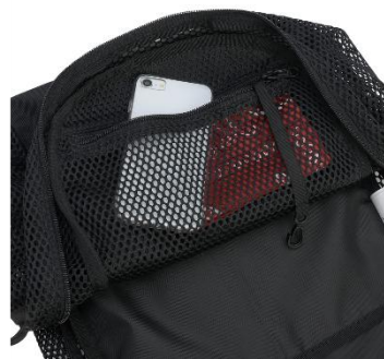
便利な小物入れスペースも