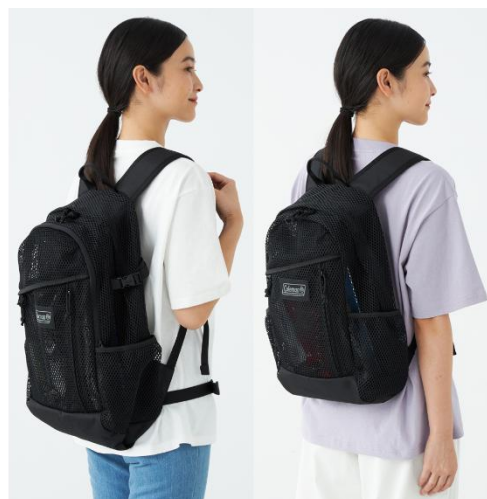
左)「ウォーカー25 メッシュ」 右)「ウォーカー15 メッシュ」