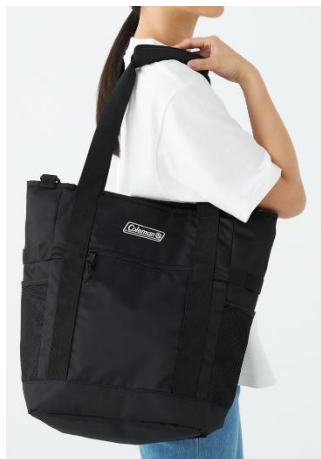
トートバッグとして