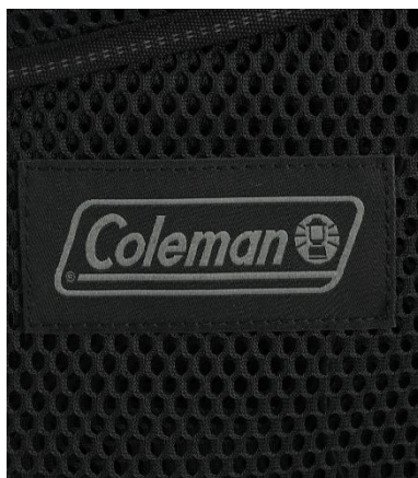
透け感があっておしゃれな メッシュ素材

の高い小物などを入れてメッシュの隙間から見せることができるファッション性を兼ね備えており、おしゃれで実用的なアイテムとしても活躍します。ドキュメントスリーブ、サイドポケットに加えて 2 つのフロントポケットも付いているので、日常使いのバッグとしても大変便利です。