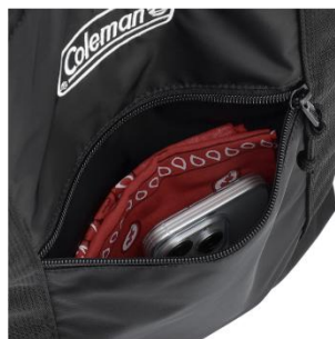
便利なフロントポケット