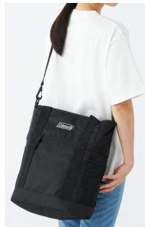
ショルダーバッグとして