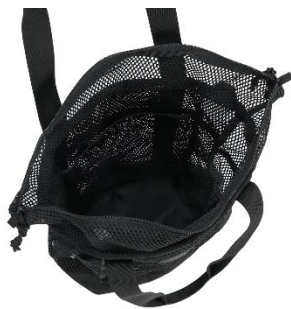
間口も広く 容量約21Lのたっぷり収納