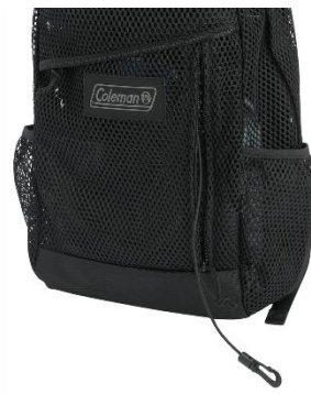
定期入れなどを付ける エラスティックコード付き