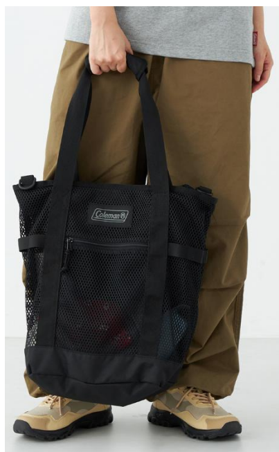
トートバッグとして