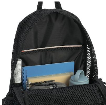
ドキュメントスリーブ付き メインコンパートメント