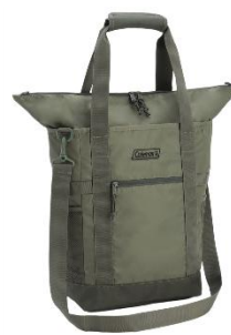
フォレストグリーン