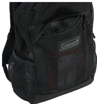
メッシュで透け感のある フロントポケット