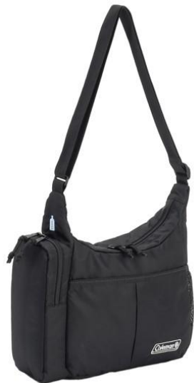
クールショルダーSM