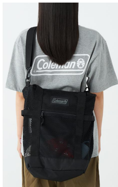
ショルダーバッグとして