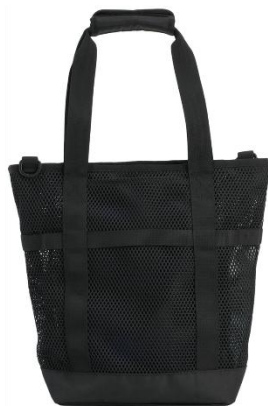
全面メッシュ生地の トートバッグ(背面)