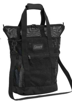
ショルダーベルトは取り外し可能 立てて高さを出せる間口も