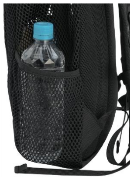
水筒も入れられる サイドポケット