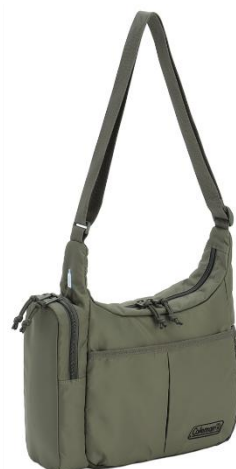
フォレストグリーン