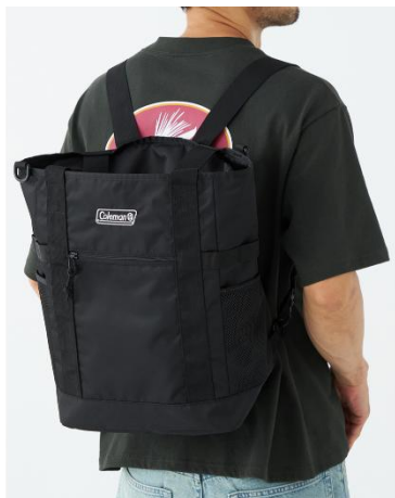
バックパックとして