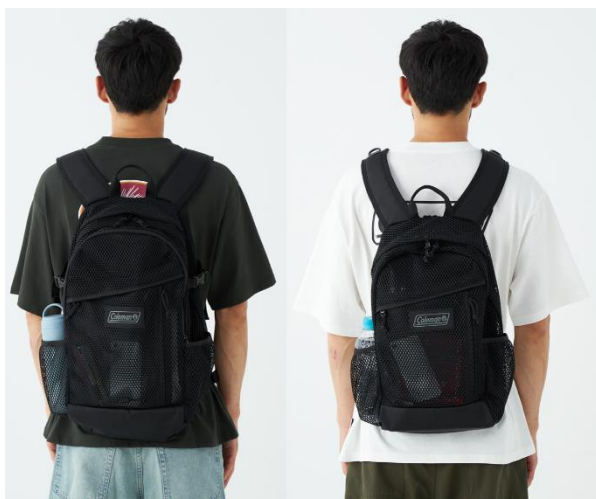
左)「ウォーカー25 メッシュ」 右)「ウォーカー15 メッシュ」