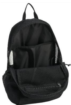
大きなコンパートメントが2つ 荷物を分けて収納可能