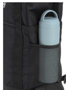
水筒も入れられる サイドポケット