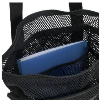
ドキュメントスリーブ付きで 高い収納性