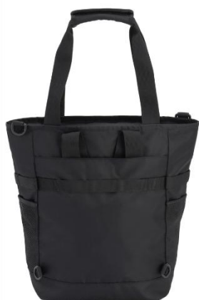
セットアップスリーブで キャリアオンにも対応(背面)