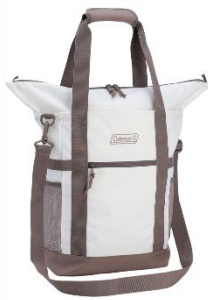
ホワイトヘリンボーン