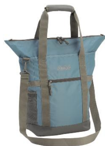
ビンテージブルー