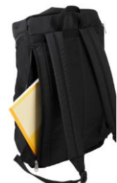
ビッグパックには メインにアクセスできるジッパー付