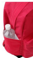
便利な COOL PKCT 付