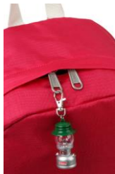
大き目ジッパーでカスタマイズ自由！