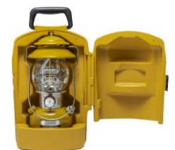
オリジナルデザインガラスグローブ クラムシェルキャリーケース

本広報資料に関する製品画像データは、「製品画像データの取扱いに関する注意事項」をご一読の上、こちらからダウンロードしてください。