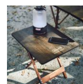
天板にハニカム構造 フレームにアルミを使用