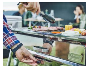
ファンで火力をコントロール