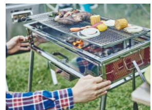
網の高さを3段階に調整可能