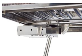
ファンの取り外し可能