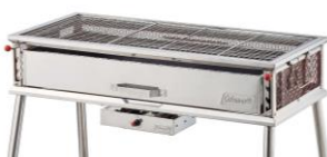
グリルの下部に電動ファン装備

従来モデルから受け継いだステンレスメッシュボディは耐久性抜群。炭床はサッと引き出せるから炭の継ぎ足しや片付けも楽にこなせます。また、火力に応じて焼網の高さを3・7・10cmに調節可能です。