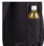
ボトルホルダー付