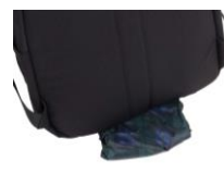
ボトム部にレインカバー装備