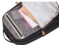
収納に最適なメッシュポケット