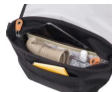
ジッパー開閉の メインコンパートメント