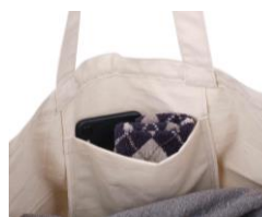
小物収納ポケット装備

本広報資料に関する製品画像データは、「製品画像データの取扱いに関する注意事項」をご一読の上、こちらからダウンロードしてください。