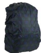
ブラックウォッチ柄のレインカバー