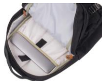
スリーブポケットを採用