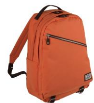
新色のマリーゴールド