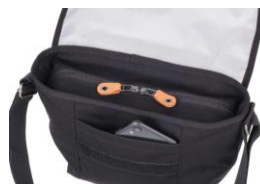
小物を出し入れしやすい オープンポケット