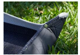
砂や小石を防ぐ立ち上がり

キャンプシーンなら、スクリーンタープと組み合わせた「グラウンドスタイル」にもオススメです。