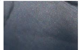
裏面は水を通さない PEVA 素材