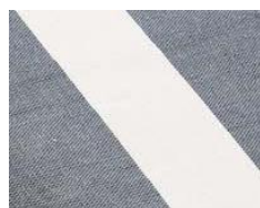
ネイビー×ホワイト

スタイルに応じて選べる4つのカラーを用意しました。いずれも落ち着いた色のあるシンプルなカラーリングなので、どんなスタイルにも合わせやすい！近所の公園に出かけた時も、広げるだけでおしゃれなピクニックが始まります。