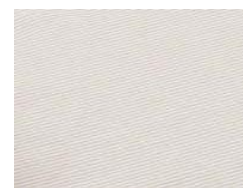
ベージュストライプ

本広報資料に関する製品画像データは、「製品画像データの取扱に関する注意事項」をご一読の上、こちらからダウンロードしてください。