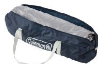
収納&持ち運びしやすいケース付き