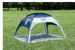
レジャーシートと組み合わせて快適に