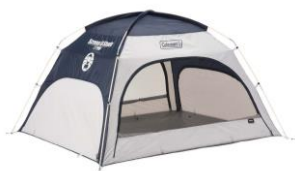
簡単設置できるクロスポール構造

サンシェードとして人気の「スクリーンIGシェード」は、一般的なテントと同じクロスポール構造なので、室内でも簡単に立てることができます。フルオープン・フルクローズでき、中でおうちキャンプを楽しんだり、子どもの秘密基地にも最適です。また約210cm×170cmのレジャーシートと組み合わせておしゃれで快適な空間を作り出すことができます。