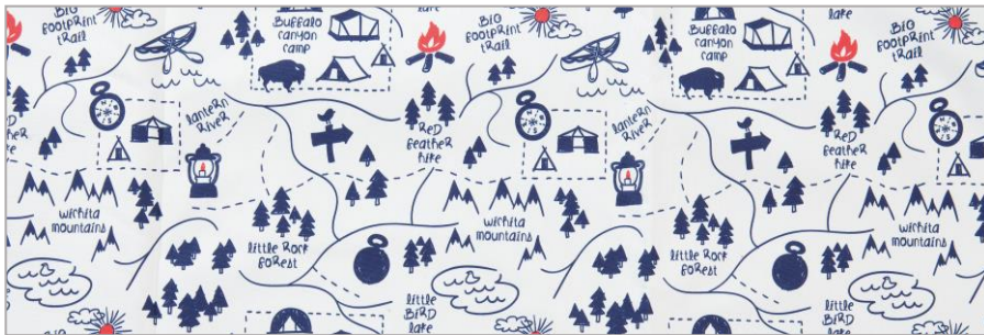
キャンプマップ柄

「キャンプマップ柄」は、湖や森、カヌーやテント、焚き火、さらにコールマンの代名詞であるランタンが散りばめられた、遊びゴコロ満載のデザインです。かわいいキャンプマップ柄がプリントされた「コンパクトグランドチェアST」、「ミニテーブル」、「コンパクトチェアテーブルセット」は、休日も外に出られない、沈んだ気持ちを楽しく盛り上げてくれます。