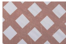
ビンテージライクのグランジプリント