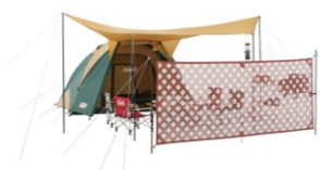
プライベート空間を確保

収納時のサイズは約φ9×長さ約59cm、重量は約1.6kg。軽量で細長い形状のため、ちょっとした隙間に収納でき、お手持ちのテントやタープに追加してもストレスになりません。