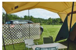
外の景色も楽しめる