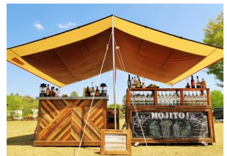
SCREW DRIVER のホットチャイづくり