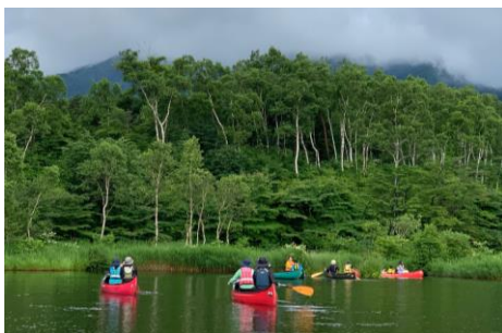
四万十塾のカヌー体験