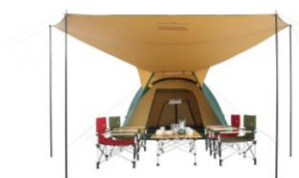
開放感のあるキャンピータープ

人気のドームテントに“オープンタープ”を組み合わせた「2ルームテント」の新しいカタチです