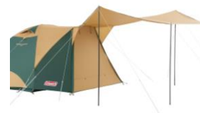
テントの前室のみクローズも可能

「ゆとりを持って過ごせる寝室」と「開放感のあるリビングスペース」を一体化させた最新型の2ルームテントです。設営はドームテントを建ててから、前室に備わる大きなタープを張り出す手順で、オープンタープの設営が苦手なビギナーにも優しい構造です。「日中」は横からの日差しや風雨を防ぐアレンジが自在にできて、「夜」は寝ている家族のために、テント前室のみのフルクローズが可能です。キャンポピーを全て巻き上げてしまえば、ドームテント単体としても使用できます。