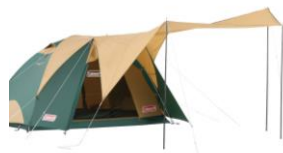
天候やテントサイトに合わせて多彩にアレンジ