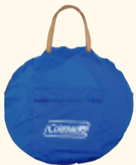
フロントポケット付 キャリーバッグ