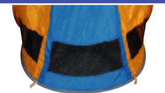
背面メッシュ 通気性抜群。