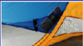
メッシュポケット 小物の収納に便利。