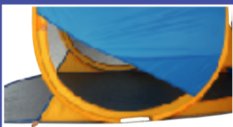
サイドメッシュ 通気性抜群。