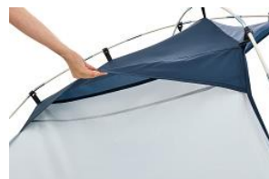
風を通すスリット式