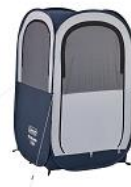
フルクローズの状態