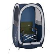
椅子を中に設置可能