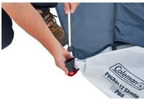
1人で設営可能なポールポケット式

収納サイズが約38cm、重さ約1.4kgなので、バッグに入れて携帯できる超コンパクトなシェードです。小さいながらも多機能で、誰でも簡単に設営できるポール一体型の簡単組立構造です。その場を離れる時やプライベートな空間が欲しい時には、シート部分を閉じてセミクローズの状態にすることもできます。大人2人または大人1人と子供2人が並んで座れるサイズです。