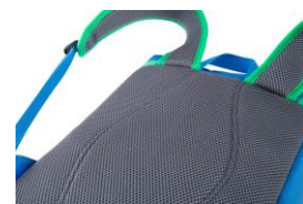
背面は通気性の良いメッシュ 素材を使用

本広報資料に関する製品画像データは、「製品画像データの取扱いに関する注意事項」をご一読の上、こちらからダウンロードしてください。