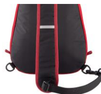
インナーに荷物を出し入れしやすい ドキュメントスリーブ付き