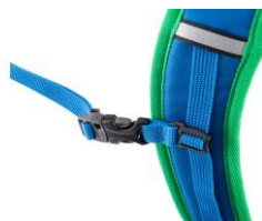
チェストストラップに ホイッスルを装備