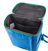
荷物を出し入れしやすい トッローディング