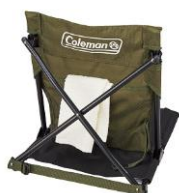
背面ポケット付き