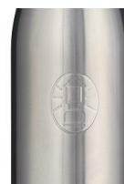
裏面に ランタンマーク

本広報資料に関する製品画像データは、「製品画像データの取扱に関する注意事項」をご一読の上、こちらからダウンロードしてください。 https://www.coleman.co.jp/press?file=https://www.coleman.co.jp/wp-content/uploads/2022/03/2022-Coleman-Parkcamp.zip