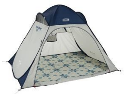
クイックアップIGシェードに ぴったりなサイズ