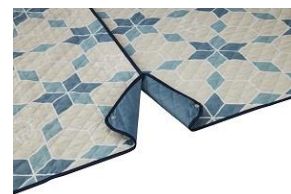
スナップボタンで連結可能