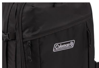
取り出しやすい縦ポケット

コンセプトである、使いやすさ、利便性はそのままに収納力と機能性をアップしました。新機能として、フロント部分に物を取り出しやすい縦ポケット、パスケースなどがつけられる伸縮性のあるコードが付属しました。これまでのデザインより、幅を調整することで、多くの荷物を入れてもボトム部分が膨らんで広がって見えることなくスタイリッシュになり、フロントデザインの切り替え部分を減らして、よりシンプルにしています。