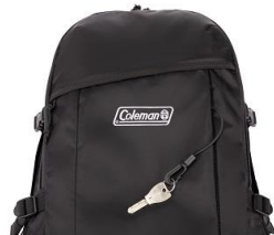
伸縮性あるコード