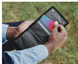
ベルクロ付きオープンポケット