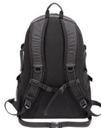
パッド入りショルダーハーネス