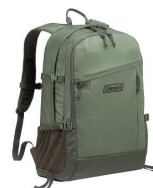
フォレストグリーン

2022年度発売のウォーカーシリーズ新色として「フォレストグリーン」と「コヨーテ」を加えました。どちらもトレンドカラーを採用しているので、普段の生活の中でも取り入れやすいアイテムとなっております。