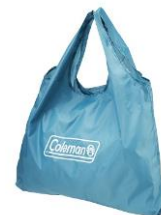
同色のエコバッグ付き

本広報資料に関する製品画像データは、「製品画像データの取扱に関する注意事項」をご一読の上、こちらからダウンロードしてください。 https://www.coleman.co.jp/press?file=https://www.coleman.co.jp/wp-content/uploads/2022/04/2022-Coleman-Dailycooler.zip