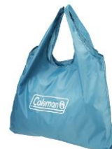
同色のエコバッグ付き