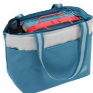
普段の買い物や ピクニックに最適な 15L

毎日の暮らしの中で気軽に使用することができるトート型のクーラーバッグです。クーラー内部には抗菌ライナーを採用しているため、傷みやすい食材や調理済みの食品を安心して持ち運ぶことができます。容量は25Lと15Lの2サイズ、カラーはミストとバターナッツの2色。容量25Lの場合は2Lペットボトル6本または350ml缶40本を収納することができます。またクーラー本体と同じカラーのエコバッグ付きで、保冷の必要が無いお菓子や日用品を分けて持ち運べます。