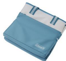
折りたたんで収納可能