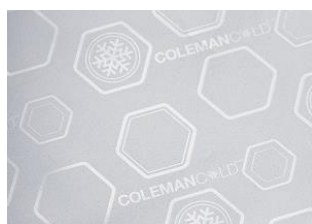
抗菌ライナー採用