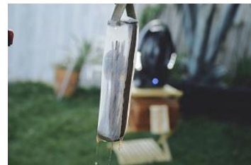
コンパクトに収納