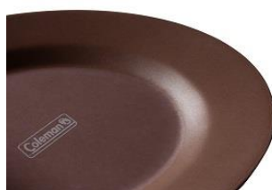
落ち着いたデザイン