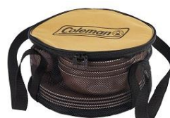
メッシュケース付き