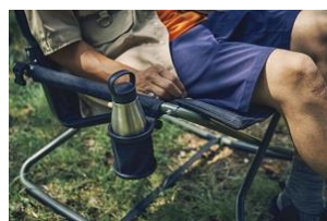
カップホルダー付