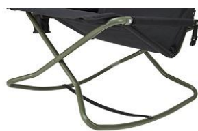
独自のフレーム設計