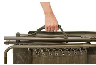
アームレスト部分の ロックレバー