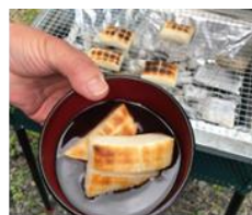
JAPAN BBQ COLLEGE 餅焼きワークショップ