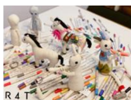
R4T 世界で一つの ココペリワークショップ