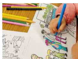
ニジノ絵本屋 ぬりえのアトリエ/POKEMON