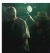
TOKYO No.1 SOUL SET