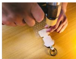
Carboleña 革製キーホルダー刻印