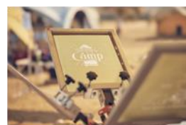
シルクスクリーン