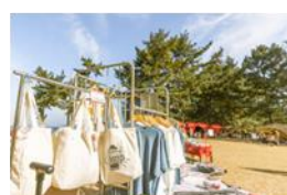
コールマンポップアップショップ