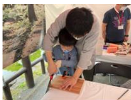
品川区商店街連合会 ミニテーブルづくり