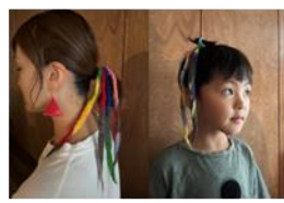
GOMA 羊毛フェルト飾りワークショップ