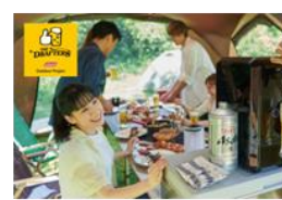
アサヒグループジャパン 株式会社/ドラフターズ