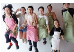
こども食堂レインボー 紙しばい/クッキング教室