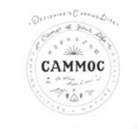
CAMMOC 防災マッチと紙石絵作り