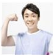
よしお兄さん (小林よしひさ)