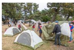
コールマンテントを立ててみよう