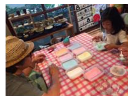
FUJICANDLE オリジナルグラスキャンドル作り