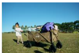
アウトドワゴンサーキット