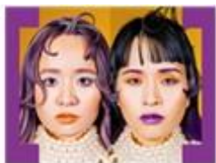
チャラン・ポ・ランタン