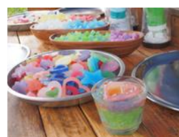
ABURABITO オリジナルキャンドル作り