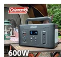
多摩電子工業株式会社