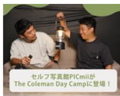
PicHive株式会社 セルフ写真館 PICmi