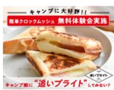
ネスレ日本株式会社 ホットサンド/クロックムッシュ体験会