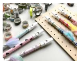
CHATOT 笛コラージュワークショップ