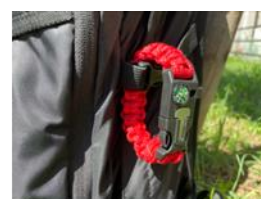
キャンプ練習場campass パラコードワークショップ