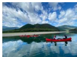
四万十塾 カヌーカフェ