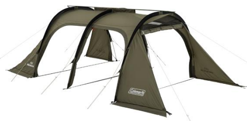
ファスナー固定式のインナーテントを取り外せば 開放感抜群のシェルターとしても使用可能