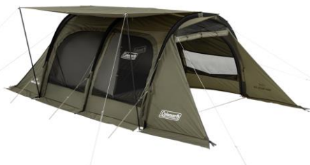
ルーフフライは面ファスナーで本体に固定 サイドキャノピーとしても使用可能