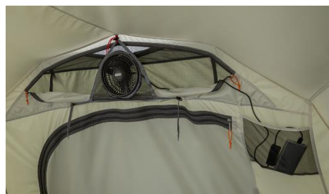
テントフロントキャノピー上部およびインナーテント後部にリバーシブルファンベンチレーション（別売）が取り付け可能