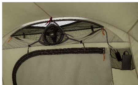
テントフロントキャノピー上部およびインナーテント後部に リバーシブルファンベンチレーション（別売）が取り付け可能