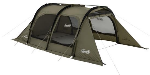
3本のアーチポールをリッジポールで押さえることで、簡単設営と剛性向上を両立させたフレーム構造

フルスカートとフロントキャノピー上部のメッシュパネルにより、効率的に空気を循環させることができ、更に換気を促す「リバーシブルファンベンチレーション（別売）」も取り付け可能なため、春～秋まで幅広い季節に対応します。