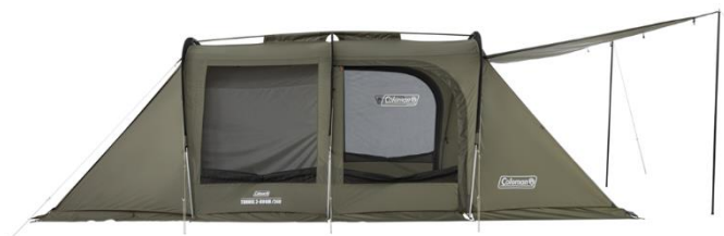
3本のアーチポールをリッジポールで押さえることで、簡単設営と剛性向上を両立させたフレーム構造

2～3人の使用に適したコンパクトなトンネル型2ルームテント。3本のアーチポールとセンターリッジポールからなるシンプルなフレーム構造により、簡単設営ながらも高い剛性を実現しています。リビング側は出入りしやすいDドアスタイル、寝室側は通気性に優れたメッシュパネルを採用。フルスカートとフロントキャノピー上部のメッシュパネルにより、効率的に空気を循環させることができ、更に換気を促す「リバーシブルファンベンチレーション（別売）」も取り付け可能なため、春～秋まで幅広い季節に対応します。