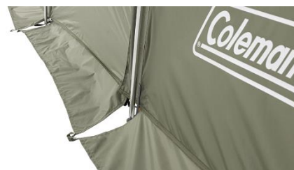
すきま風や虫の進入をシャットアウトするフルスカート装備