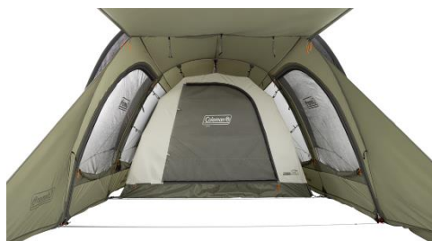
インナーテントは吊り下げ式